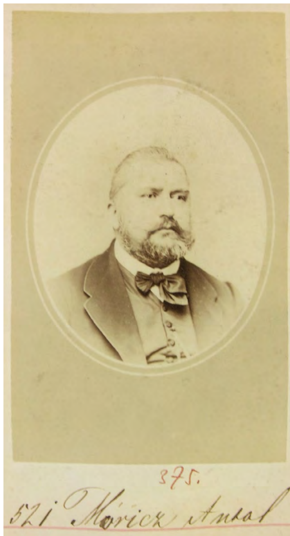
■ Móricz Antal arcképe, 1870–1871 körül

Móricz Antal legfiatalabb öccse, Lajos Fényes Bertát (?), 1839 – Szatmárnémeti, 1906)