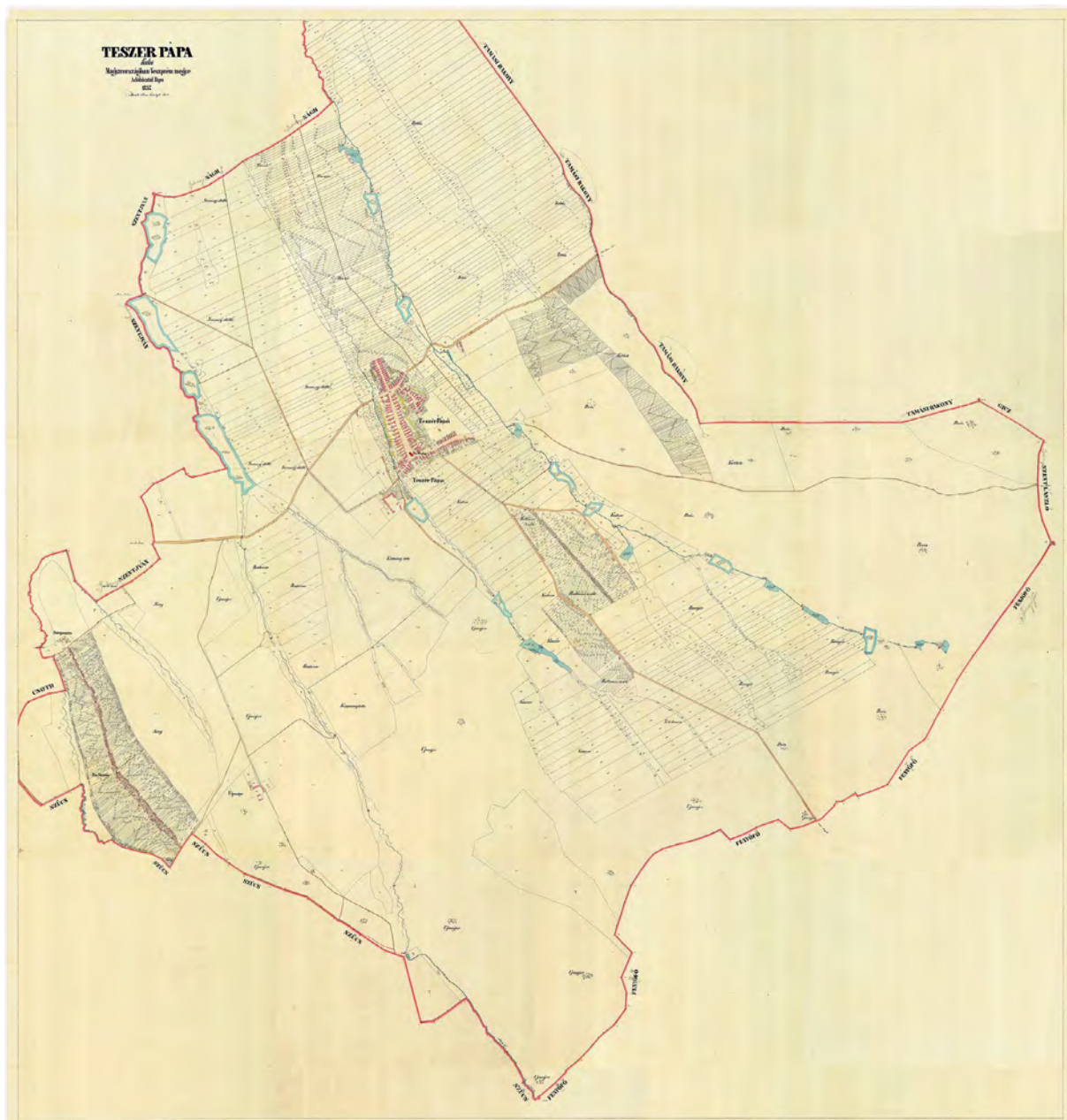
■ Pápateszér kataszteri térképe, 1857 (MNL OL, S 78-2389.)

A vízimalmot a malomépülethez rajzolt ☼ szimbólum jelöli, Pápateszér község bel- és külterületén 25 ilyen jelölést találunk az 1857-ben felvett kataszteri térképen, valamennyi gabona-őrölő malom volt. 4