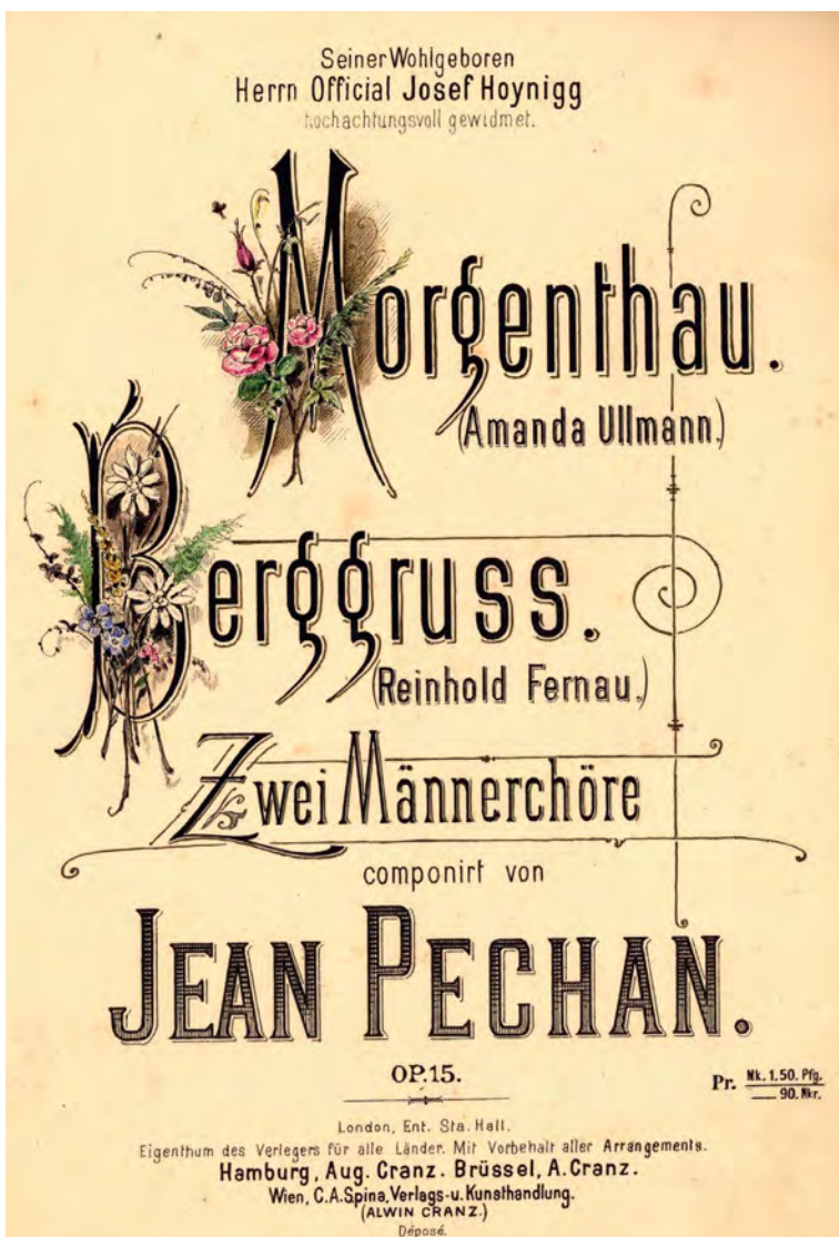
■ A Morgenthau és a Berggruss férfikarra írt művek kottaborítója (MNL BaVL, X.56.b. Pechán)

1879-ben fejezte be tanulmányait a pancsovai főreáliskolában. Nem volt jó tanuló, meg kellett ismételnie a 8. osztályt, mert megbukott a bölcsészettől – későbbi pályáját tekintve legalábbis érdekes módon – mennyiségtanból és a mértani rajzolás és ábrázoló mértan tantárgyakból is. 8 Az ismétlés sem sikerült túl fényesen, mértani rajzolás és ábrázoló mértanból csak elégségest kapott (négy jeggyel érté-