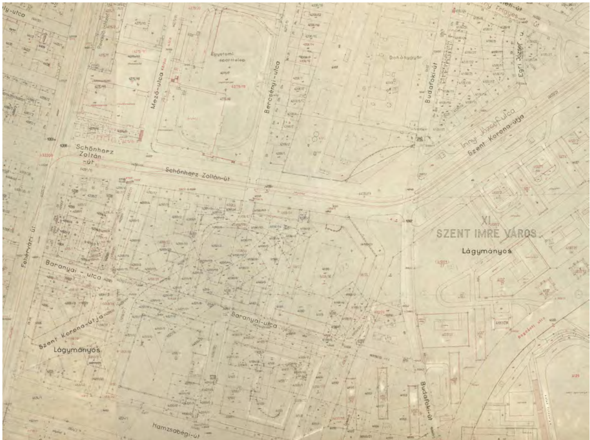
■ A XI. kerület háború előtti felmérése szerint még „Szent Imre-város”, de már megjelennek a „Lágymányos” feliratok is. A Szent Korona út tervezett nyomvonalát itt még ábrázolták

het elérni a terepi illesztőpontok kiválasztása során. 4