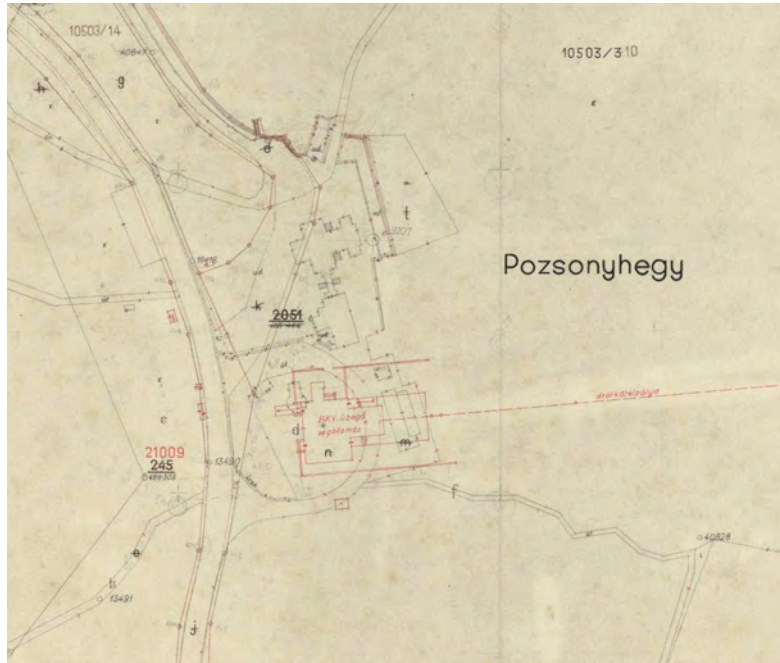
■ A Libegőt jóval a XII. kerületi szelvények felmérése után tervezték és építették, de nyomvonala és a végállomási épületek (a képen a felső állomás és az Erzsébetkilátó) piros színnel fel vannak tüntetve (BFL, XV.16.g.201/cop53)

„Szent Imre város” név szerepel, mellette a későbbi „Lágymányos” felirattal. A Szent Korona út (ma: Irinyi József utca) tervezett meghosszabbítását is láthatjuk még, amelyet a lágymányosi lakótelep 1962-ben befejeződő építése tett végképp lehetetlenné.