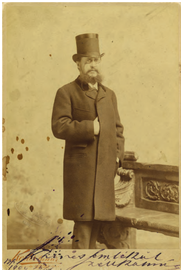
■ Széll Kálmán (1843–1915) miniszterelnök, belügyminiszter, 1900 körül.

megye adminisztrációja élén a jelenlegi alispán állott akkor is, mikor a legnagyobb atrocitások és visszaélések követték el, úgy a választók összeírása alkalmával, mint a képviselőválasztások alkalmával [...] nekem [...] megvan a gyanúom arra nézve, hogy ez a szerencsétlen körjegyző, aki egyéb bajokban is leledzik, magasabb instrukciók következtében járt el. Ő nem mert volna ilyen cselekedetet elkövetni, és nem mertek volna mások sem, ha erre nézve nincs felsőbb helyről utasításuk. Hol az a felsőbb hely? Az alispán. Az alispán utasítja a főszolgabíró, megadván egyúttal neki az instrukciót is. A főszolgabíró már tudja, hogy [...] az összes tényezők egyetértenek abban, hogy a vizsgálat ne