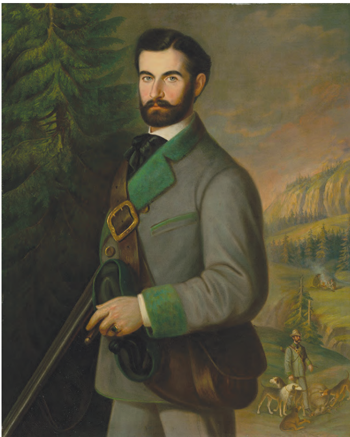
■ Zmeskál Zoltán (1841–1921) néppárti politikus.

Hamarosan kiderült, hogy Ochodnicán a földadócenzushoz mintaként kiválasztott Grissza András telkének nagyságával kapcsolatban egymásnak ellentmondó adatok vannak feltüntetve: a kijelölés során az adót – kerekítve 6 koronát, azaz 3 forintot – a kataszteri telekkönyvben és birtokívben is szereplő 13 hold után vették fel, ám a föld nagyságát már csak hét holdnak tüntették fel. Mindez hét