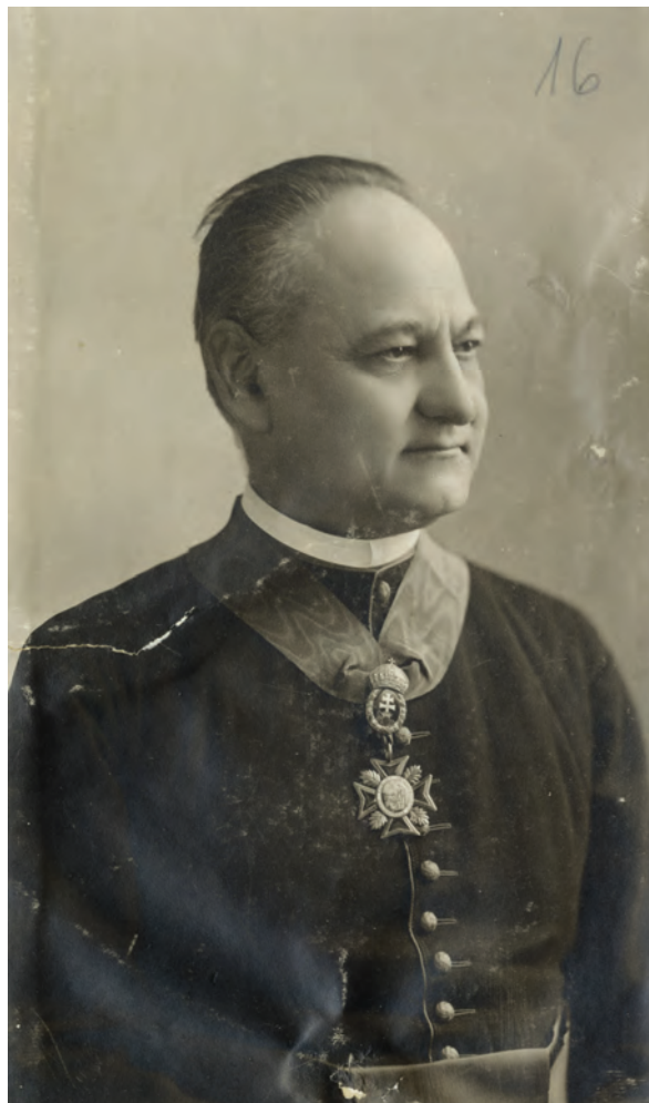
■ Molnár János (1850–1919) néppárti politikus

Miután az ügy alapos, objektív kivizsgálásának sürgetése hatástalannak bizonyult, Molnár János 1900. december 13-án ismét felvette, hogy az ochodnicai körjegyző továbbra sem kapott büntetést amiatt, hogy hét hold után tizenhárom kataszteri hold adóját vette