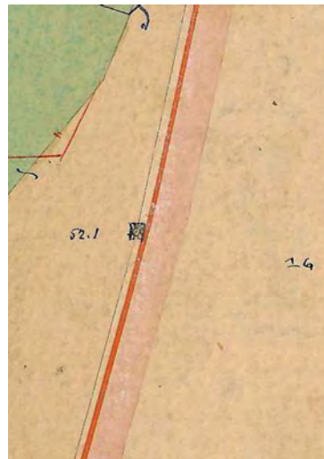
■ 16. számú határdomb jelkövel, Jászdózsa 1884. évi birtokvázlatán

Jászdózsaé 1884-ben történt, így a jelkő állítására ebben az időben kerülhetett sor. 5