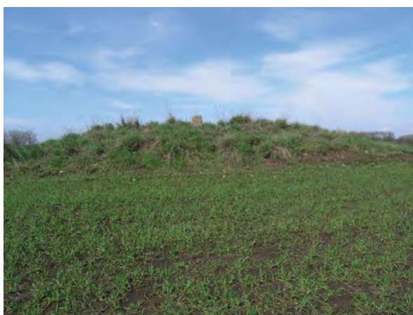
■ A határdomb a jelkövel Jászapáti felől, keleti irányból nézve

a múlt század hatvanas éveiben, a nagyüzemi szántóföldi táblák kialakításakor.