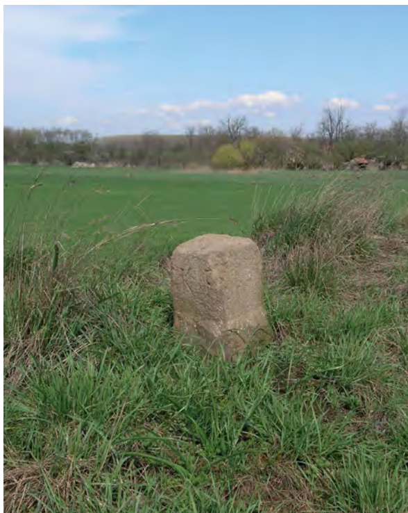
■ Jászdózsza-Jászapáti határdombon lévő jelkő