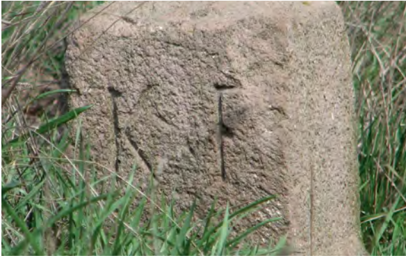
■ A határdomb a jelkövel Jászapáti felől, keleti irányból nézve