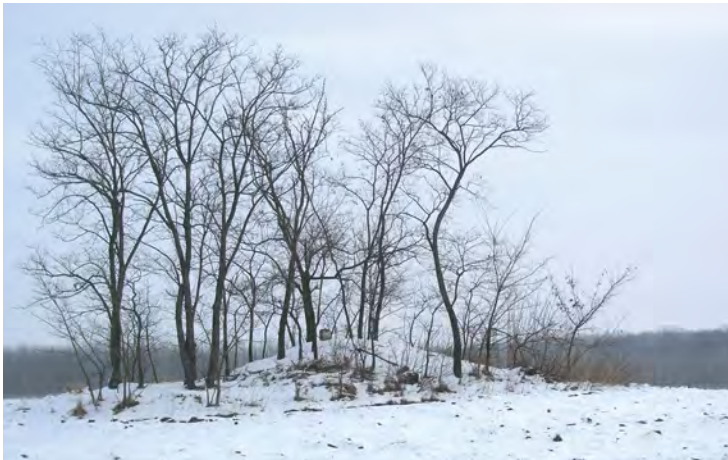
■ Köves határdomb jelkövel Pusztamonostor és Jászfényszaru határvonalán