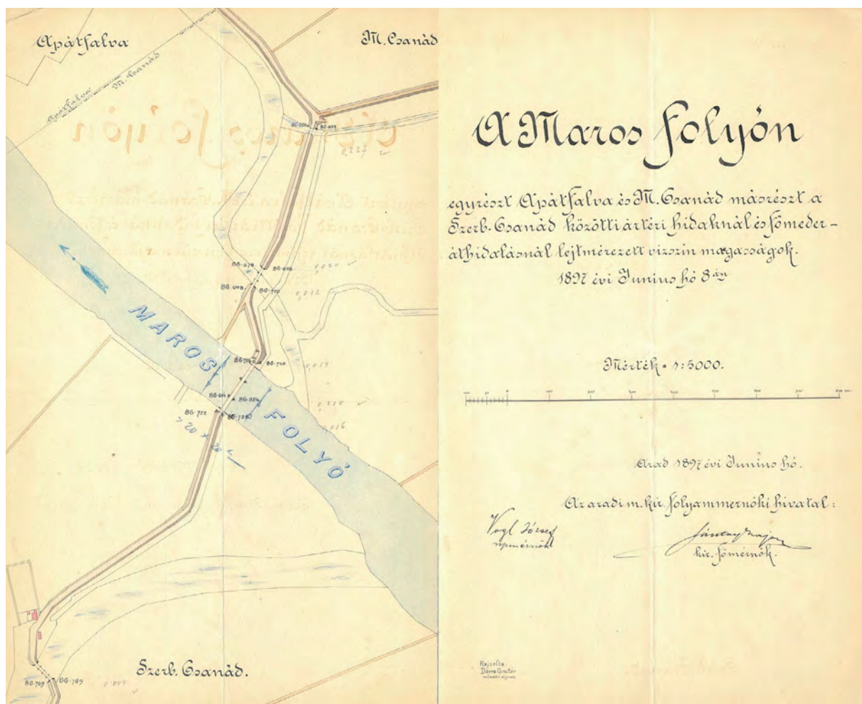
■ A Maros térképe Apátfalva, Magyar- és Nagycsanád környékén. Rajzolta Dörre Gusztáv műszaki díjnok, 1897 (MNL OL, S 118 - No. 555.)

dapest, 1950. 02. 04.) térképet is szerkesztett. A Magyarország néprajzi térképe című, 1:900 000 méretarányú térkép 1920 körül Klósz György és Fia, valamint a Társadalmi Egyesületek Szövetsége kiadásában is megjelent. 8