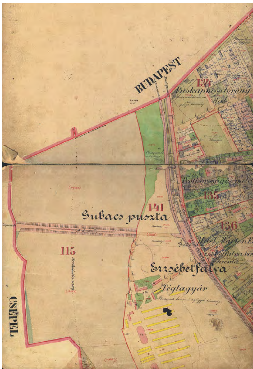
■ Dörre Henrik: Soroksár birtokvázlatának részlete, 1882 (MNL OL, S 78 - Pest m. - Soroksár 1882 - 1.)