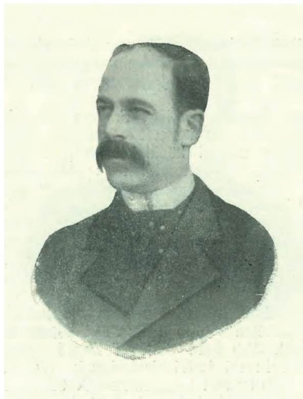
■ Földes Béla (1848–1945) közgazdász, statisztikus, egyetemi tanár, 1917. augusztus 18. és 1918. május 8. között átmenetgazdasági tárca nélküli miniszter (Magyar országgyűlési képviselők arcképcsarnoka 1906–1911. Bp. 1906.)

Springer Ferenc (Budapest) felszólalásában ismertette a Gazdaszövetség és az Országos