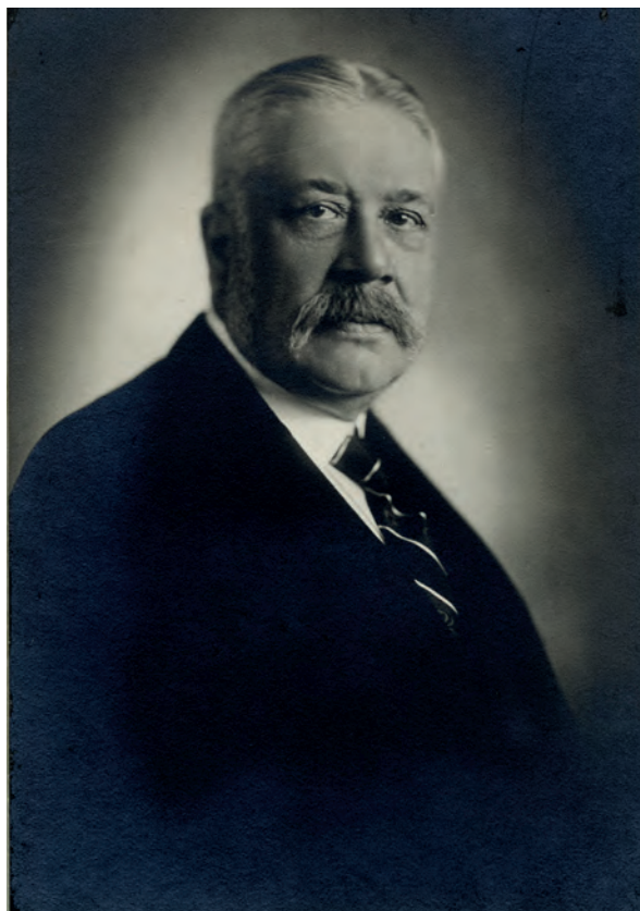
■ Popovics Sándor (1862–1935) 1918. február 11. és 1918. október 31. között pénzügyminiszter, felsőházi tag, belső titkos tanácsos, a Magyar Nemzeti Bank első elnöke

A pótlékkal kapcsolatban a főrendiházban is volt egy kisebb felzúdulás, aminek nyomán Popovics Sándor pénzügyminiszter megnyug-