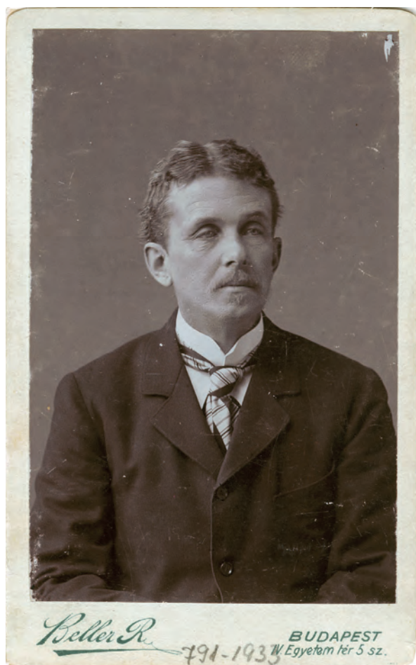
■ Esterházy Mihály gróf (1884–1933) országgyűlési képviselő, vadász (MNM TF, 791-1933)

Nagyatádi Szabó István (Somogy vármegye, Nagyatád) a bérleti díj alapján való ingatlan-értékbecslést tekintette a legkorrektebb módnak és – a törvényjavaslattal egyetértésben – a kataszteri tiszta jövedelem