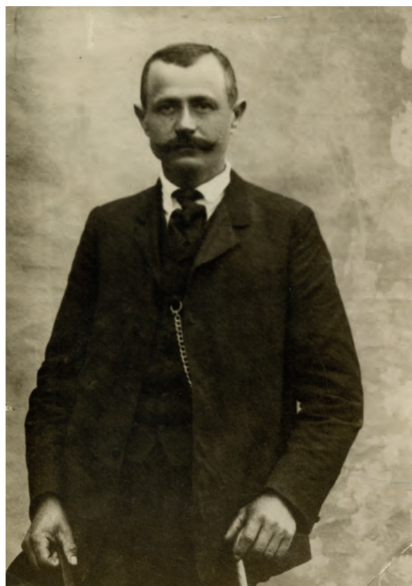
■ Nagyatádi Szabó István (1863–1924) politikus, 1919. augusztus 15. és augusztus 27. között földművelésügyi miniszter, az első országos magyar parasztpárt alapítója (MNM TF, 872-1949)

Polónyi Géza pedig arról beszélt, hogy a birtokososztály már nagyon sok adót fizet: földadót, jövedelmi adót, házbéradót, miközben vannak olyan területek, amelyek adómentesek, például a be nem épített városi telkek. A vagyoadó e területeket illetően az első adó