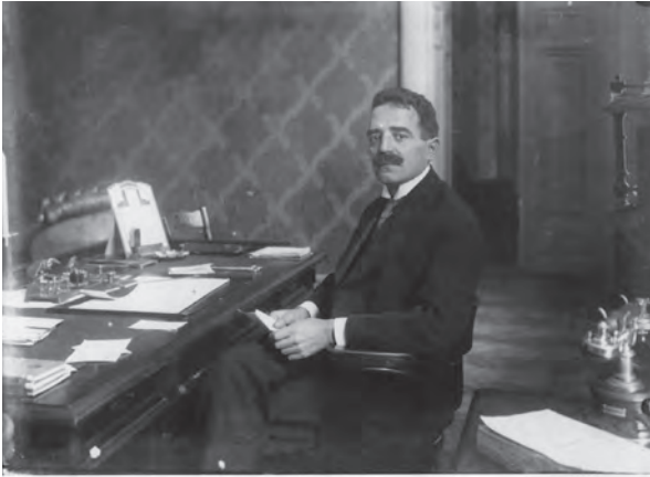
■ Abrahám Dezső (1875–1973) ügyvéd, képviselő, a második szegedi ellenkormány miniszterelnöke 1919. július 12. és augusztus 12. között

tatta gróf Somssich Lászlót, hogy „miután a 60%-os pótlék, amelyet a földadónál behozni szándékozunk, mindenben az egyenes állami adó természetével bír, úgyhogy azok a rendelkezések, amelyek az egyenes állami adóknak a jövedelemadó alapjából való levonására vonatkoznak, természetesen a pótlékre is kiterjednek”. 27 A törvényjavaslat az 1918:IX. törvény-cikként szentesített.