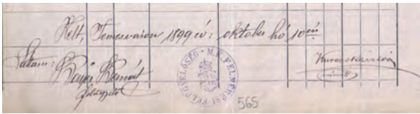
■ Komlói – akkor még Kurecska – István aláírása (MNL OL, S 92. No. 25/4. 565.)

Komlói a magyar nyelv mellett francia, német és román nyelven is tudott. 10 Egyéves önkéntes katonai szolgálatát a császári és királyi 32. gyalogezredben töltötte 1901–1902 között, ahonnan a szolgálati és védkötelezettség teljesítése után, rendfokozat megtartása nélkül bocsátották el. 11