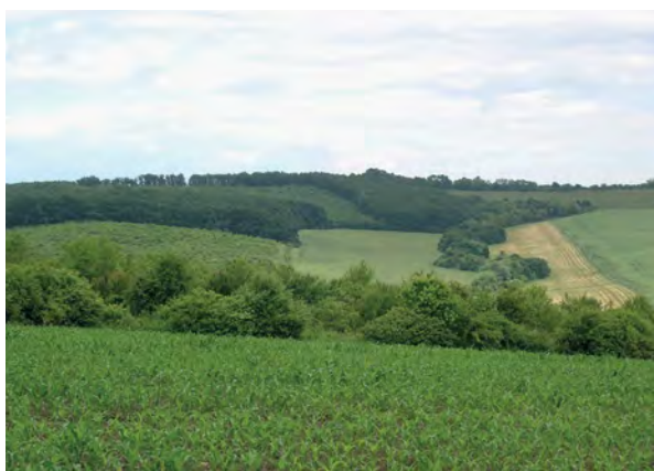
■ 1. Damak, Órhegy (2020)

Sem a helytörténeti, sem a nyelvészeti irodalomban eddig nem közölt Órhegy magaslatnév volt a középkorban a Borsod vármegyei Sajószentpéteren is, amit egy szőlőbirtok nevéként az 1409-ben leírt végrendelet őrzött meg (... vineas scilicet Ewrhegh ). 8 A név azonban sem a történeti, sem a mai térképek egyikén sem szerepel, ezért ennek az Órhegynek a helyét eddig sajnos nem tudtam térképi forrással alátámasztani. A hely azért mégis nagy va-