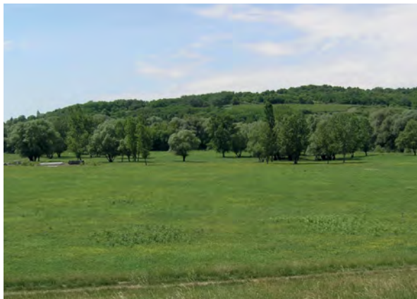
■ 7. Helemba, Órhegy (2022)

A poltári Órhegyről két középkori oklevél is szól. Károly Róbert 1332-ben adományozta el a király és családja ellen merényletet elkövető Zách Felicián poltári birtokát – és leíratta