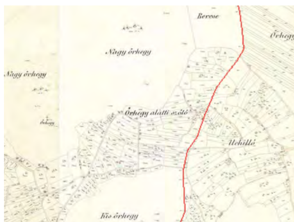
■ 5. Örhegy dűlőnevek Bajna (1887) és Epöl (1886) kataszteri térképén – északi részlet