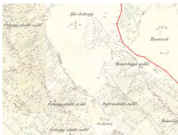
■ 6. Örhegy dűlőnevek Bajna (1887) és Epöl (1886) kataszteri térképén – déli részlet