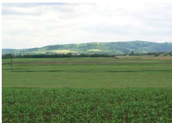
■ 3. Sajószentpéter, Örhegy (2020)

Bajna kettős Örhegyét (4. kép) a török hódítás következtében a 16. század közepén elpusztult Nyék falu 1423. évi határleírása említi (... ascensive ad montem Ewrhegh ). 9 Akkor Bajna települése a jelenlegi helyéhez képest nyugatabbra feküdt. Az Esztergom vármegye déli szegélyásvjában fekvő kettős magaslaton a 15. században három – ma már nem létező – település: Nyék, Bercse és Csamaszombatja határai találkoztak. Valószínűleg teljes egészében az egykori Bercse területén emelkedett az északi magaslat, és Nyéken volt a déli.