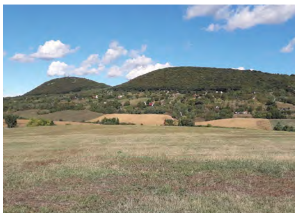
■ 4. Bajna, kettős Örhegy (2022)

Csamaszombatjához tartoztak a déli hegylábát már akkor is elfoglaló szőlőültetvények. Az oklevél megemlíti kelet felé Epöl szomszédságát is, amelynek a területe ma – Bajnával határosan – az Örhegy északi és keleti lábáig terjed, a középkorban azonban a mai helyéhez képest keletebbre volt a falu. A kataszteri térképeken (1886 és 1887) olvashatók azok a dűlőnevek, amelyek a kettős Örhegyről kapták nevüket. „Nagy Örhegy”-nek nevezik az északi – valójában alacsonyabb – erdős magaslatot, és „Kis Örhegy”-nek a délit. Epölon „Örhegy” nevű szántó, Bajnán a déli és a nyugati hegylábán is „Örhegy alatti szőlő” névvel szőlődűlők voltak. A nyugati és a déli oldalon, a szőlők alatti patak völgy sávja pedig „Örhegyalja” nevet kapott (5. és 6. kép). 10 A hegy neve a középkortól