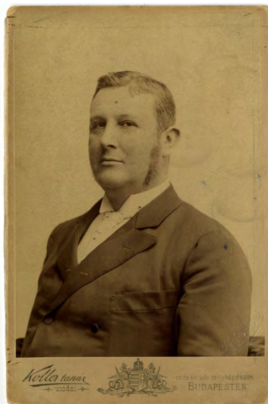
■ Wekerle Sándor (1848–1921), a Pénzügyminisztérium vezetésével megbízott miniszterelnök 1894-ben