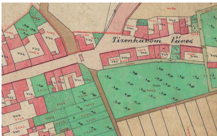
■ Részlet Szombathely város 1857. évi birtokvázlatából (MNL, VaML, XV.1.c.A. K-259)