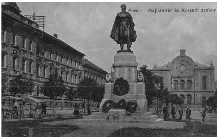
■ Kossuth-szobor a pécsi Majláth téren 1917-ben

A pécsi felmérési felügyelőség ügyviteli iratainak tanulmányozásával konkrét példákat láthatunk a városi ünnepekre. Két választott évben (1908, 1912) vizsgáltam meg az iktatókönyveket, hogy azokban milyen utalások történtek az ünnepekre. 1908-ban a pécsi főispán az uralkodó koronázási évfordulóján tartott istentiszteletre hívta a hivatalt. 38 1912-ben