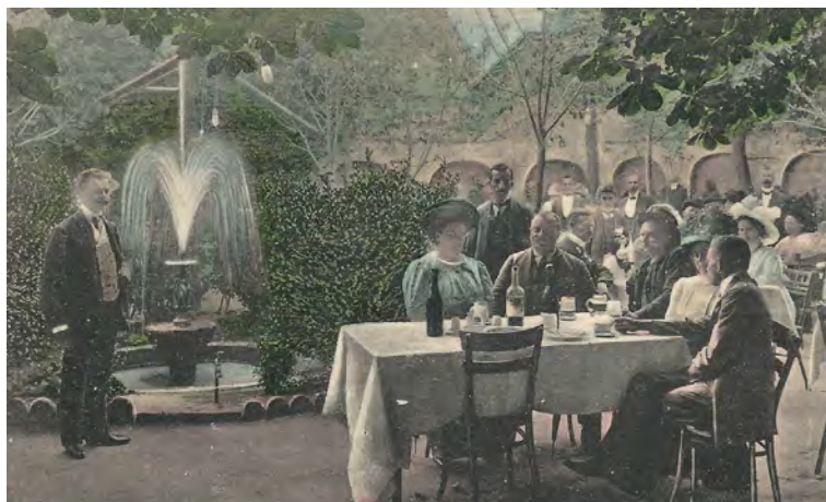
■ A pécsi Gambrinus vendéglő 1914-ben

majd valaki kérdezni fogja, hogy mikor is vett búcsút tőlünk: Hát május végével, a Halley-üstökösrel együtt távozott tőlünk, mely szép csillag, ha majd a ránk nézve utolsó ízben látható sugarával búcsút int nekünk, azzal talán azt akarná mondani, hogy: »Viszontlátásra!«? Kedves üstökös, 75 év múlva egyikünk sem fog már élni. De talán van – oh, szép hit! – viszontlátás egy szebb csillagról, ahol az ünnepelt oldalán a mai napról megemlékezni fogunk. 26