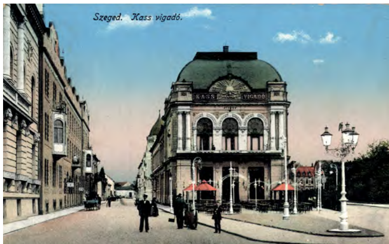
■ A Kass Vigadó 1910 körül (Zempléni Múzeum, 77775)

1895-ben Zemlicka Károly háromszögölő főmérnök (Budapest) és a Nyitrán állomásozó 7. felmérési felügyelőség főnöke, Füssl János felügyelő tartotta meg 40 éves jubileumát. 17