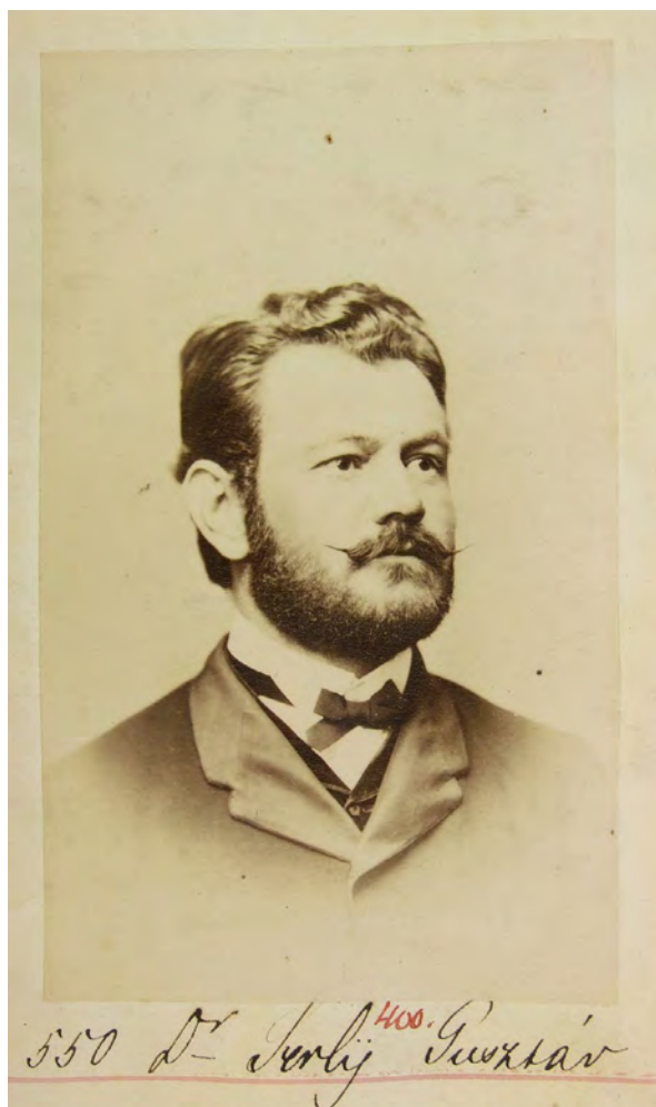
■ Dr. Serly Gusztáv arcképe, 1870–1871

mányt követve Máramaros vármegye tisztkarában vállalt hivatalt, 1841-től négy éven át a szigeti járás alszolgabírója, ezt követően pénztárnok és házi főadószedő volt. Az 1848. évi első népképviselési választáson Técsőn országgyűlési képviselővé választották. Az országgyűlésről 1849. április 5. után távozott, a szabadságharc leverése után hadbíróság elé került, de mint „kevésbé terhelt egyén” kegyelmet kapott. Az 1850-es években Taracközben, később Nyírbélteken élt, állami hivatalt 1854-ben vállalt újra törvényszéki ülnökként, ekkor már Bereg-