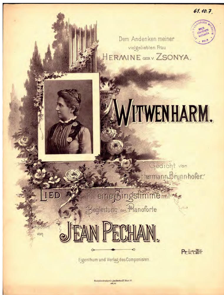
■ Az Özvegyi bú című kottaborítója (MNL BaVL, X.56.c.3.97. Kottatár)

1885. november 18-án vezetett oltár elé szülővárosában. Két leányuk is született, Aurora és Hulda, ám mindketten meghaltak pár hónapos korukban. Az alföldi városban 1888-ig dolgozott, ez alatt az idő alatt komponálta meg első magyar dalát Kölcsey Vágy című költeményének megzenésítésével, ami nyilvánvalóan a gyermek elvesztése miatt keletkezett trauma feldolgozásában segítette („ Megenyhűl majd sebem, / Mely most kínnal temet ”). 14