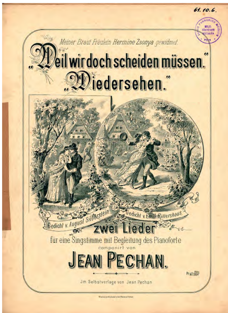
■ Két, feleségének ajánlott zongoradarab kottaborítója