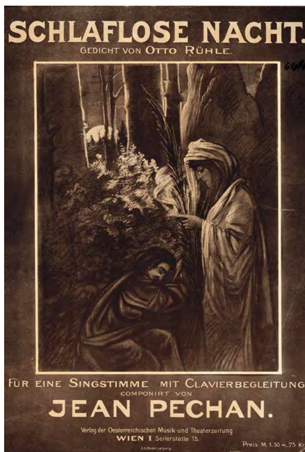
■ A Schlaflose Nacht című mű kottájának borítója és első oldala (MNL BaVL, X.56.c.3.97. Kottatár)

ramentuma ”, precíz, de „óvatos” munkavégzés jellemezte. 43 Olyan szavak, amelyek egy érzékeny lelkű, álmodozó, kissé introvertált, ám jólelkű, kötelességtudó, a durva világot talán kicsit felülről szemlélni tudó, igazi művészember képét rajzolják ki előttünk, aki ugyanakkor képes volt arra, hogy a dolgokat a helyükön kezelve elválassza a magánéletet a hivatal világától.