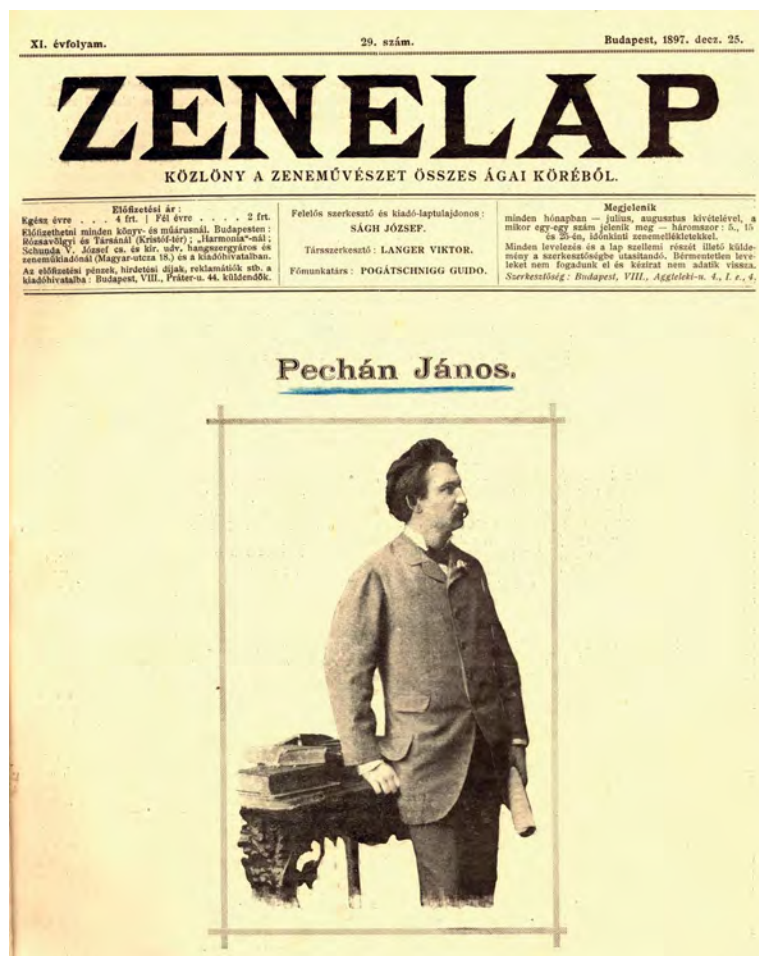
■ A Zenelap 1897. karácsonyi számának címlapja

vált igazán ismertté, pályadíjat nyert Umsonst című műve, és a külföldi kiadók is előszeretettel adták ki munkáit.